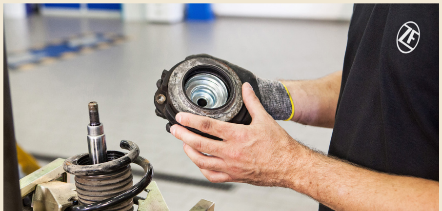
Auch verschlissene Teile wie Federdomlager zu diagnostizieren und auszutauschen gehören bei der Fahrwerksüberprüfung zu den Hauptarbeiten.