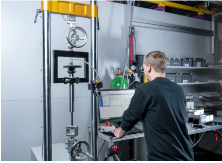
Auch im Aftersales besteht in der Entwicklung von modernsten Schwingungsdämpfertechnologien noch viel Potenzial, um Kunden sportlichere Fahrwerksabstimmungen als der OEM bieten zu können. Bei KW Automotive werden die Dämpfer nicht nur entwickelt, sondern auch gefertigt.