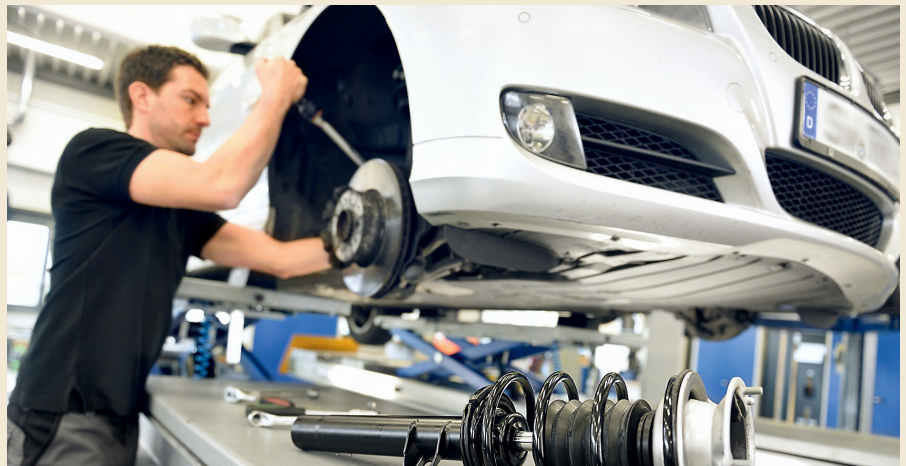
Das Fahrwerk stellt die Verbindung zwischen Rad und Karosserie her. Bei Arbeiten rund ums Fahrwerk gilt die Nullfehler toleranz. Auch das Gefahrenpotenzial von vorgespannten Schraubenfedern, die bei der Demontage mit einem Federspanner gesichert werden, wird vor allem von Hobbyschraubern unterschätzt.

Deshalb gilt in der Werkstatt bei Fahrwerksarbeiten höchste Konzentration und Sorgfalt. Kein Wunder werden auf den kantonalen Strassenverkehrsämtern die Fahrwerksteile inklusive Federung und Dämpfung (sowie Bremsen) genauestens kontrolliert. Nur einwandfrei arbeitende Systeme gewährleisten die Sicherheit im Strassenverkehr. Der Garagist mit ausgebildetem Werkstattpersonal garantiert diese Sicherheit und erntet dafür grosses Vertrauen des Kunden.