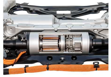
Aktive Wankstabilisatoren erfreuen sich bei den Herstellern insbesondere dank 48-Volt-Bordnetz und bei SUV grosser Beliebtheit. Im Verbund mit regelbarer Luftfederung und adaptiven Schwingungsdämpfern wird das Kurvenwanken trotz hohem Schwerpunkt massiv reduziert.

Einfachste Systeme, wie Ford im aktuellen Focus anbietet, erhalten eine Schlaglocherkennung. Dabei werden die Federbewegungen ausgewertet. Beschleunigt das Rad rasch aus oder in den Radkasten (Schlagloch oder Erhöhung), verkleinern Magnetventile den Öldurchfluss und verhärten je nach Situation die Druck- oder Zugstufe. Dank blitzschneller Auswertung vermag das Rad nur wenig Bewegung durchzuführen, bis das System reagiert. Es kann kurzzeitig dem Fahrbahnverlauf (Schlagloch) nicht folgen, hängt kurzzeitig in der Luft und verhindert ein Aufschlagen des Reifens und im Extremfall der Felgenhörner auf die Schlaglochkante. Entsprechend entfallen ebenso zu grosse Kräfte auf die Karosserie und die Langlebigkeit der Fahrwerkskomponenten ist höher.