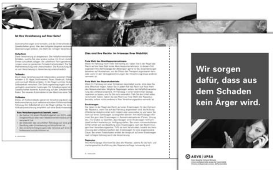
Garagenkunden müssen über ihre Möglichkeiten und Rechte informiert sein.

Das Thema Schadenmanagement beschäftigte auch im vergangenen Jahr viele Garagenbetriebe. Sie befinden sich zunehmend im Wettbewerb mit den Motorfahrzeugversicherungen, wenn es darum geht, als erster Ansprechpartner im Schadenfall aufzutreten. Um dieser Entwicklung zum Nutzen der AGVS-Mitglieder entgegen zu wirken, wurde in einer Arbeitsgruppe eine Kundenbroschüre erarbeitet, die seit April 2009 erhältlich ist. Sie soll die Garagenkunden mit interessanten und nützlichen Informationen sensibilisieren und gezielt auf ihre Möglichkeiten und Rechte hinweisen.