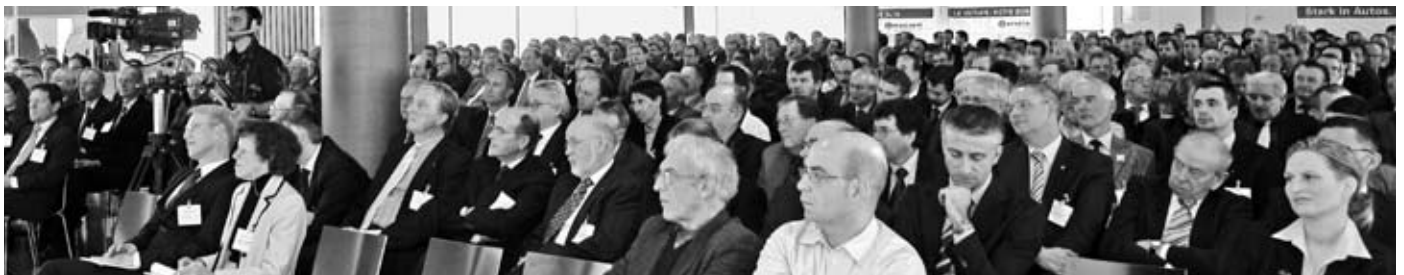
An seiner Tagung im Januar lancierte der AGVS das Kommunikations-Schwerpunktthema «Das Auto in der Öffentlichkeit».

Alle anwesenden Verbände und Organisationen befürworteten die Weiterführung der KFZ-Bekanntmachung in der Schweiz.