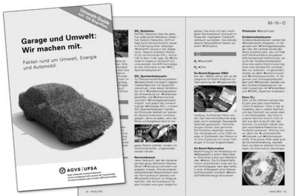
Der Umwelt-Guide hilft mit markenneutralen Informationen, Fragen der Kunden und Mitarbeitenden in Garagen zu beantworten.

Um den Kontakt zu den AGVS-Mitgliedern wie auch zu den Automobilistinnen und Automobilisten verstärkt zu pflegen, hat der