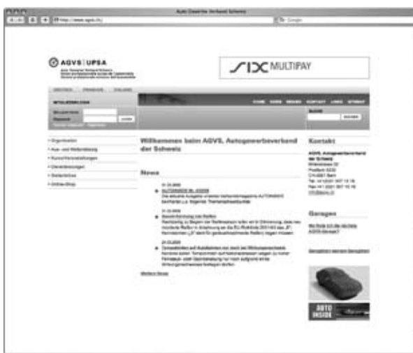
Modern, attraktiv und leserfreundlich strukturiert: Der AGVS präsentiert zu Jahresbeginn seinen neuen Web-Auftritt.

Zu Jahresbeginn schaltete der AGVS seine neu überarbeitete, grafisch attraktive Website frei. Erfreulicherweise wurde die integrierte Gestaltungsversion für die AGVS-Sektionen ebenfalls grösstenteils umgesetzt. Es ist für den AGVS Schweiz ein zentrales Anliegen, mit den 20 Sektionen und 5 Untergruppen als tragende Säulen seine regionale Verankerung und damit die notwendige Marktnähe zu gewährleisten.