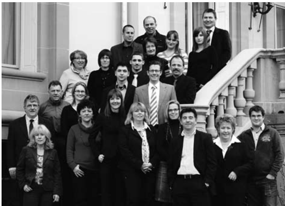
Im Dienste der AGVS-Mitglieder: Die Mitarbeitenden der Geschäftsstelle setzen sich täglich mit Rat und Tat ein (nicht vollzählig).