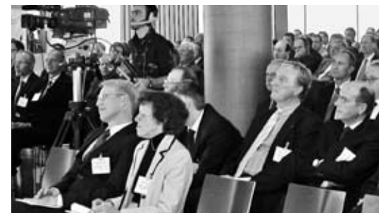
L'UPSA a lancé son thème de communication principale

Depuis fin janvier 2008, la nouvelle brochure (BB) n° 5 pour la branche automobile est disponible. Les cercles intéressés ont été invités au préalable à prendre position sur les projets de la BB et sur les notices accompagnatrices. L'UPSA, en collaboration avec des experts en TVA, a élaboré