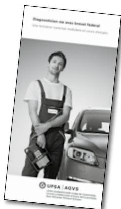
Nouvelle brochure informative sur les formations continues UPSA en accompagnement professionnel.

En 2008, l'offre de formation à la Business Academy a été rendue encore plus polyvalente et plus attractive par rapport aux années précédentes. Les membres de l'UPSA utilisent de plus en plus souvent la possibilité de se perfectionner sur des thèmes