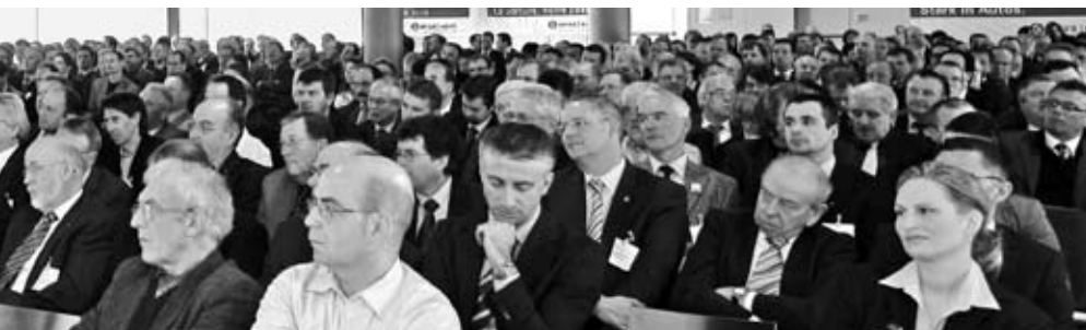
«L'automobile dans l'opinion publique» lors de son colloque en janvier.