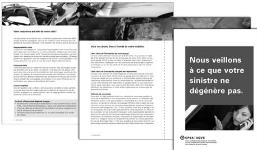
Les clients des garages doivent être informés de leurs possibilités et de leurs droits.

Depuis avril 2008, GE Money Bank propose le nouvel instrument de calcul 'Cockpit'. Il intègre également le tableau de calcul EasyFix pour les crédits de réparations. Cockpit offre des avantages attractifs aux garages: le calcul pour tous les produits y compris les requêtes par fax y sont réunis. On peut calculer en une seule démarche un leasing, le financement, le financement plus, une simulation de leasing ou EasyFix. L'application est claire et facile d'utilisation.