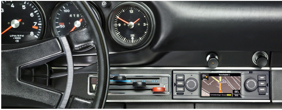
Pour les véhicules plus anciens, les FEO mais aussi les fabricants d'appareils commercialisent des solutions de rechange avec réception DAB+ et appareil de navigation. Leur look s'inspire de celui des appareils classiques.