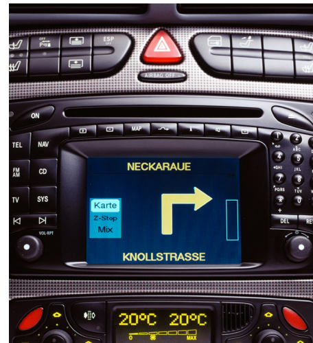
De tels appareils de navigation ne pourront plus traiter les informations liées au trafic ni proposer d'itinéraires bis : le TMC disparaîtra après le débranchement des émetteurs FM.

tèmes de navigation de calculer un itinéraire bis. Le TA fonctionnera toujours sur certains appareils DAB+. Il existe aussi le standard TPEG (Transport Protocol Experts Group), qui est plus rapide, plus précis, et permet à Via Suisse, qui prépare les données liées au trafic, de transmettre plus précisément la longueur et la fin des embouteillages. Certains constructeurs ont installé la connexion TPEG dans leurs véhicules. D'autres misent dès le début sur les données de trafic en ligne, qui sont transmises au véhicule par la connexion Internet. <