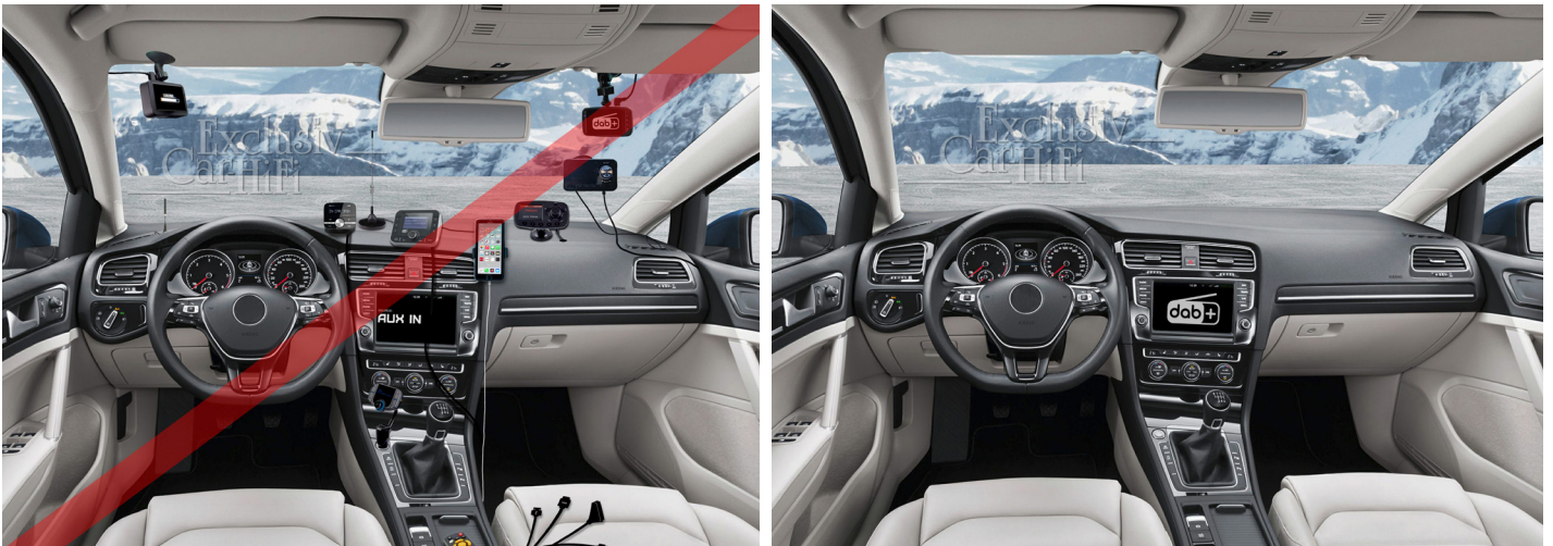
Il existe différentes possibilités pour s'équiper du DAB+ : la meilleure variante est l'intégration complète dans le système d'infodivertissement existant (à droite).

À compter de mi-2022, les programmes radio de la SSR ne seront plus diffusés en analogique. Les radios privées, qui ont convenu d'un débranchement anticipé, passeront aussi rapidement au numérique à la même période. Par conséquent, les autoradios analogiques se tairont au plus tard à partir de 2023. Des possibilités de rééquipement intéressantes s'offrent aux garagistes pour le stock existant de véhicules. Andreas Senger