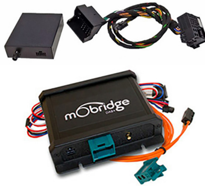
Les unités de commande additionnelles qu'on trouve sur le marché sont moins chères que les variantes USB, bus CAN (photo du haut) ou MOST (photo du bas) et peuvent être intégrées au véhicule au moyen d'interfaces programmables de manière, par exemple, à ce que la commande au volant fonctionne.

Souvent, les clients ne souhaitent pas dépenser autant d'argent. Ils peuvent alors opter pour l'ajout d'adaptateurs DAB+ cachés, que l'on trouve dans le commerce à partir de 550 francs, et qui sont donc bien meilleur marché. L'avantage des récepteurs entièrement intégrés est qu'ils permettent de conserver la commande au volant, la commande tactile de la radio et le dispositif mains libres. La réception radio DAB+ prévoit également une baisse de volume en cas d'appel téléphonique entrant. La visualisation se fait par l'écran de la radio. Aucun appareil supplémentaire visible n'est intégré. Les adaptateurs bon marché avec câblage visible (intégration partielle) devant être placés dans l'habitacle ne satisfes-